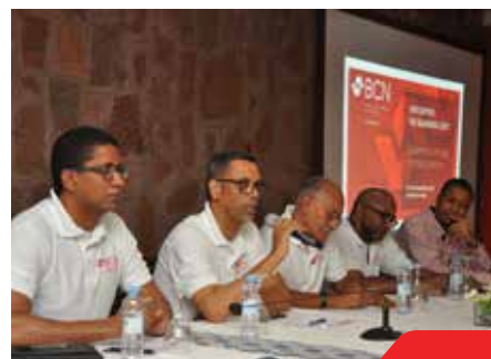
>> Encerramento do encontro